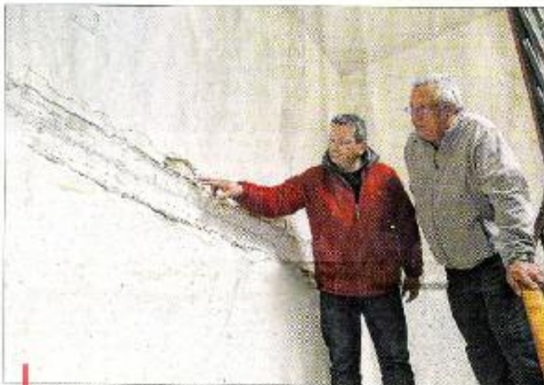
À La Condamine, le maire constate l'étendue des dégâts dans l'un des appartements communaux.

Une secousse plus intense qu'en février 2012 Malgré la nuit tombée, les maisons se sont instantanément vidées et les habitants courus, parfois en robe de chambre, sur la place devant d'aller inspecter les éventuels dégâts. Mais, ce n'est qu'au petit matin qu'ils ont pu prendre la mesure de l'importance des dommages. "Les dégâts matériels sont nombreux. Il s'agit de fissures dans les murs et des chaudières déformées ou défectueuses", explique Vincent Caron, sous-préfet de Barcelonnette, sur le terrain une grande partie de la nuit aux côtés des maires fraîchement élus. "La première alerte du 25 septembre précédent, avait duré jusqu'à 30 secondes du matin, et il