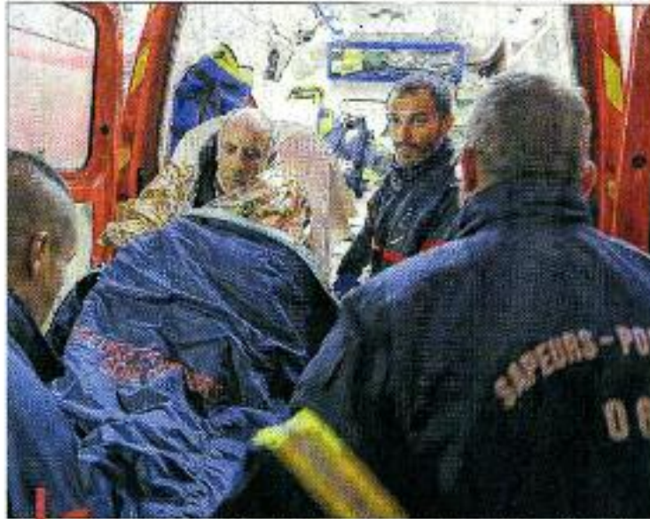
Les blessés, âgés de 24 à 73 ans, étaient originaires des Alpes-Maritimes, à l'exception du mari de la touriste russe.

Les investigations, confiées à la gendarmerie et au bureau enquête accidents, devront faire la lumière sur les circonstan-