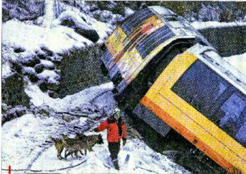
Une vue d'ensemble rétrospectif le secteur à 300 mètres du lieu de l'accident.

Tragique fatalité Un jour, tout va très vite. Les premiers secours sont sur place 3 minutes à peine après le choc d'un train de l'accident qui a juste le temps de voir de la fumée s'échapper de la machine, puis plus rien. Nous sommes arrivés juste par la parovole, mais nous n'avons pas pu. Nous sommes donc arrivés par