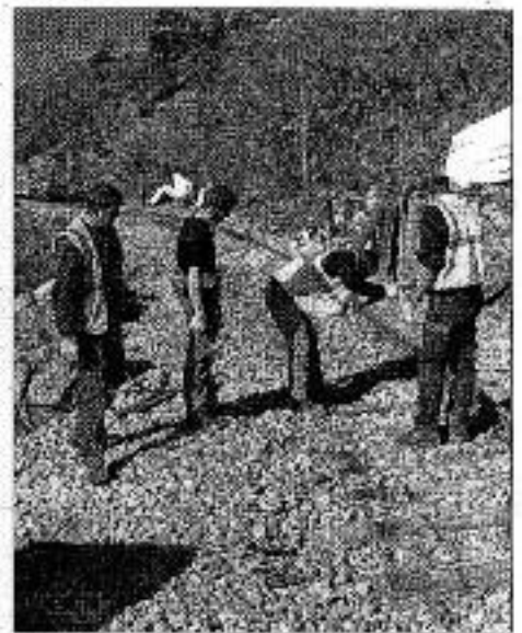
La piste accueillera les premiers véhicules ce soir, au grand soulagement de la population et des commerçants du haut pays. En surplomb le personnel des Chemins de fer de Provence s'affaire à la réfection des rails.

travaillé à la dépose des rails tordus ou cassés et à la repose d'autres rails afin de faire passer sur le site deux rames de train, deux Micheline bleues.