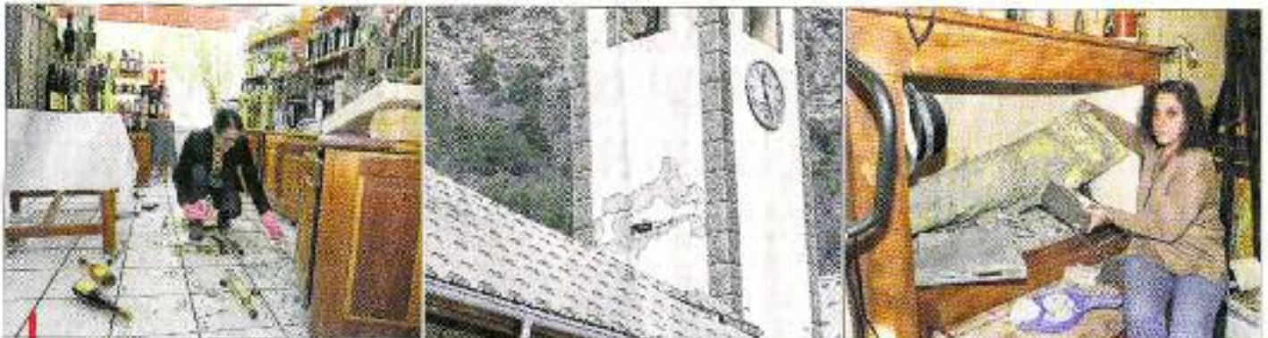
Après une nuit noire, les habitants ont découvert hier matin les conséquences de la catastrophe : à la Maison du Pays de Jausiers, à l'église de La Condamine mais aussi dans un bureau de Jausiers.